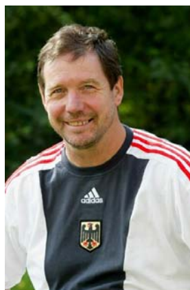
Dr. Karl Quade

mitzuhalten“ sagte Quade nach seiner Berufung. Die XIII. Paralympischen Sommerspiele finden vom 6.-17. September 2008 in Peking statt. Es werden 4.000 Athleten aus 150 Nationen erwartet, die in 471 Disziplinen um die Medaillen kämpfen werden. Der Deutsche Behindertensportverband stellt traditionell einer der größten Mannschaften. Bei den Spielen 2004 in Athen belegte man den 8. Platz in der Nationenwertung.