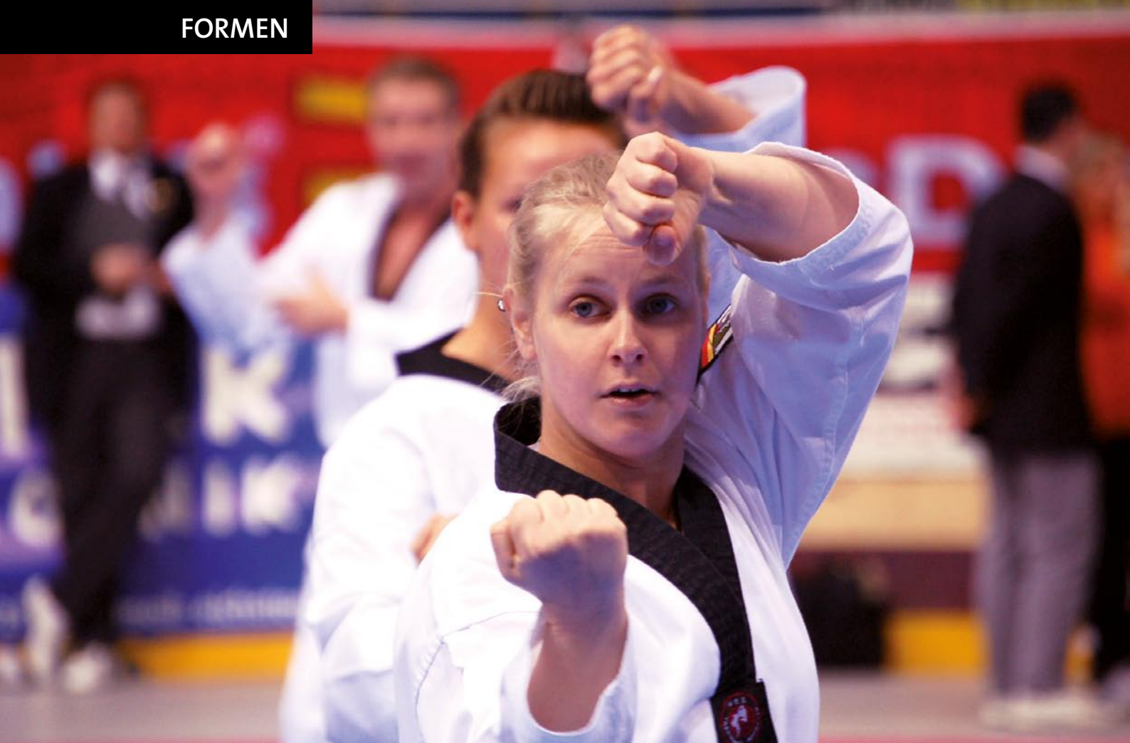
NWTU Team Mixed Senioren 1