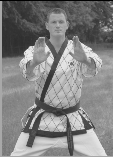
Bernd Große Daldrup Bronze WM Europameister